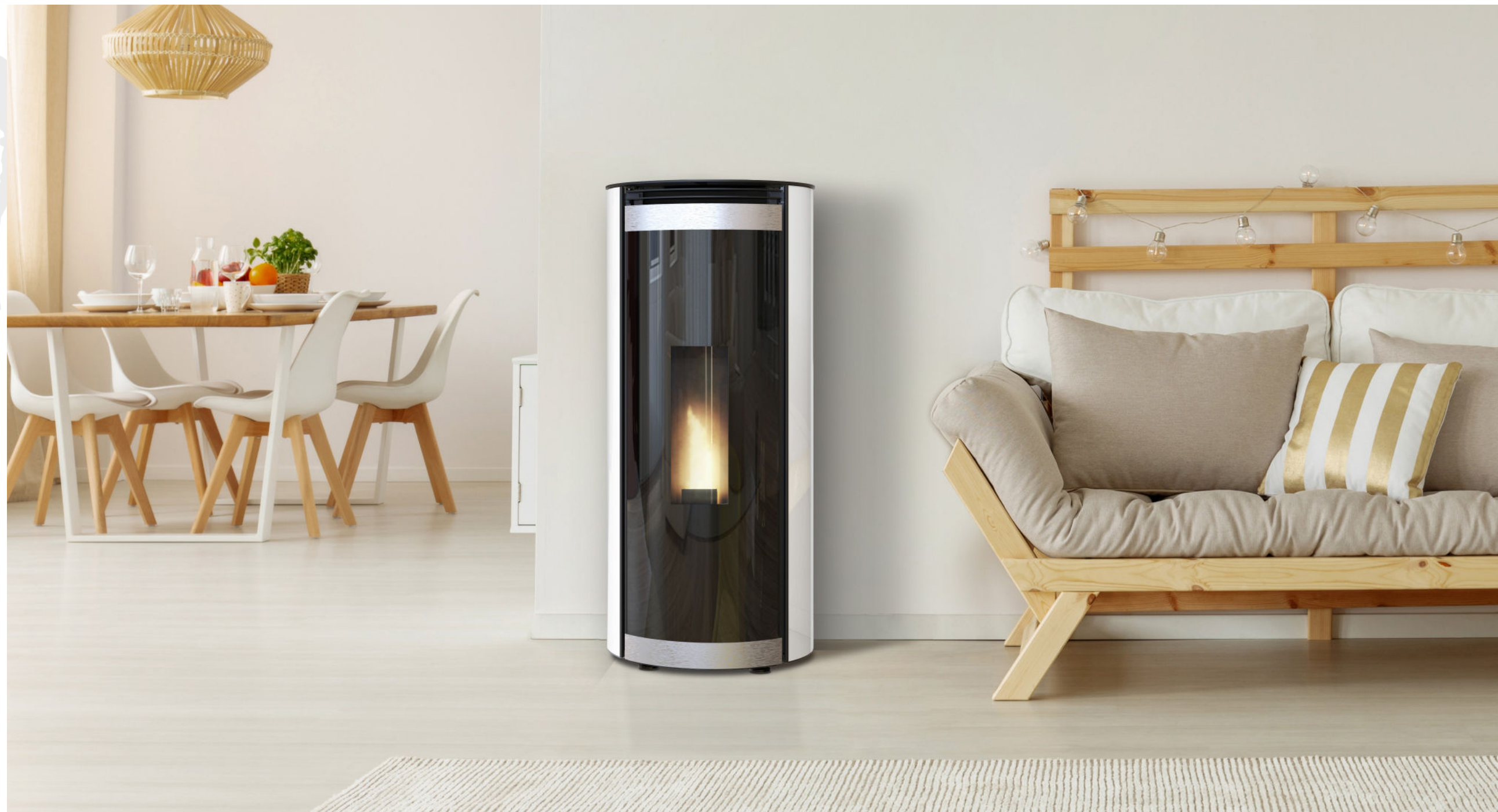
NANO TODRA GLASS / 6.5kW ETANCHE / HABILLAGE EN VERRE BLANC / PORTE EN VERRE / TOP EN ACIER