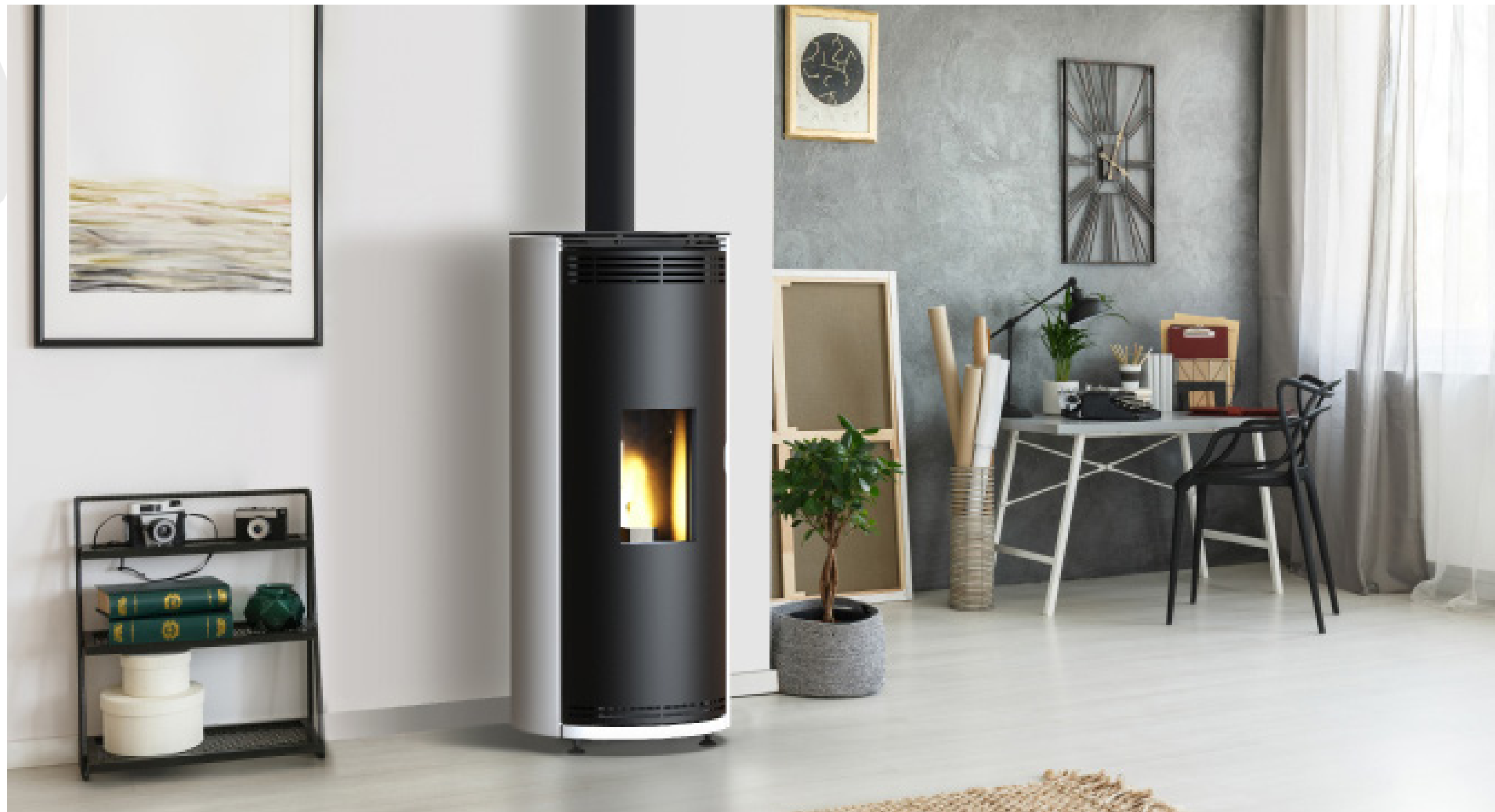
PREVERT / 8kW ETANCHE / HABILLAGE ACIER GRIS CLAIR / PORTE EN ACIER / TOP NOIR COULISSANT