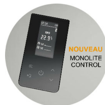
NOUVEAU MONOLITE CONTROL