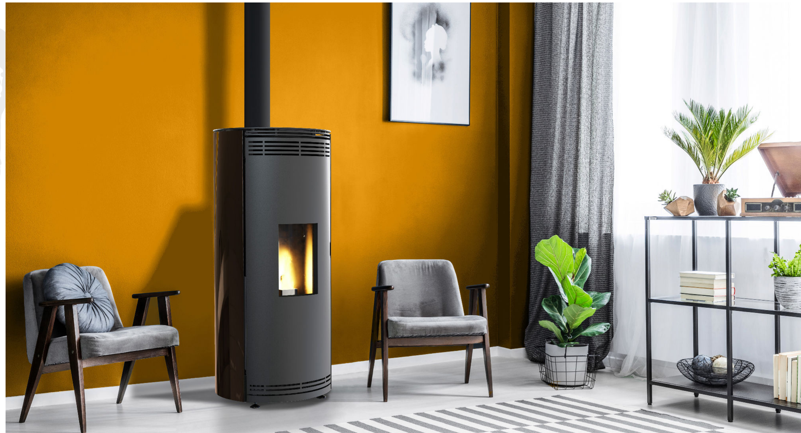
PREVERT GLASS / 8kW ETANCHE / HABILLAGE VERRE BLANC / PORTE EN ACIER / TOP EN ACIER NOIR COULISSANT