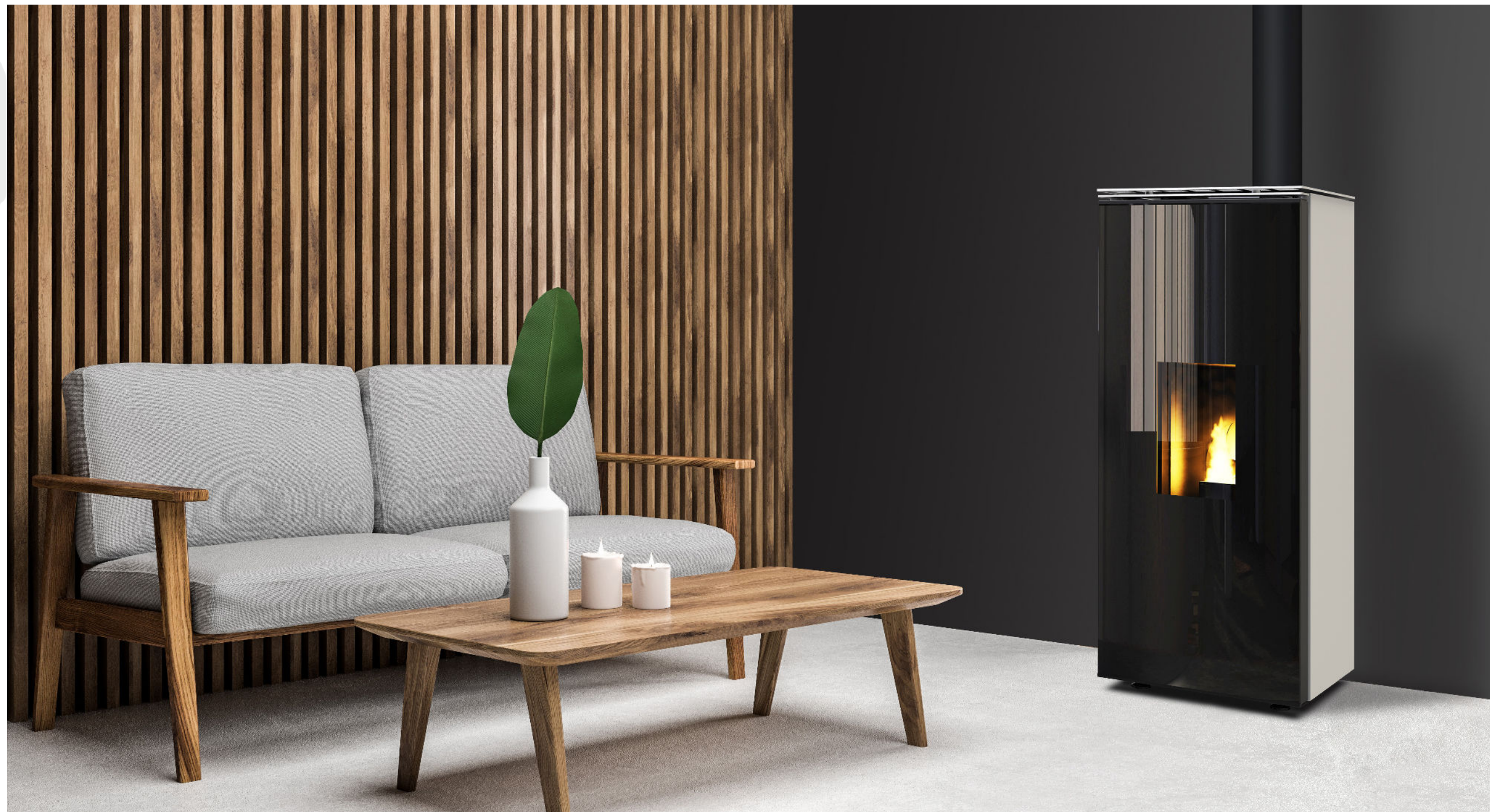
STENDHAL / 8kW ETANCHE / HABILLAGE ACIER GRIS CLAIR / PORTE EN VERRE / TOP COULISSANT

Option : WIFI disponible (uniquement avec le display 5 touches)