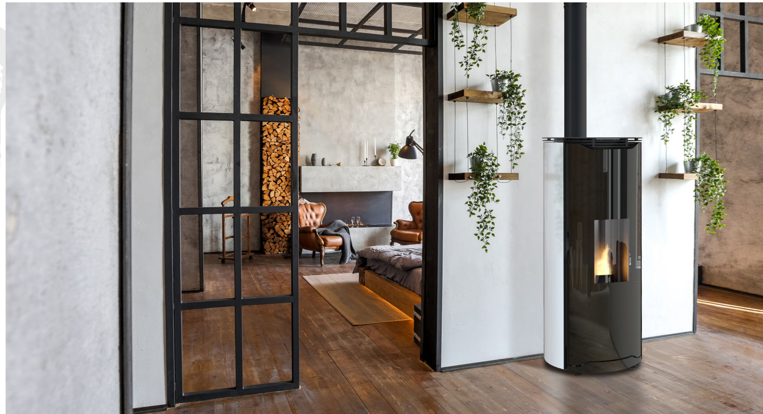
VERLAINE GLASS / 8kW ETANCHE / HABILLAGE VERRE BLANC / PORTE EN VERRE / TOP EN ACIER COULISSANT

Option : WIFI disponible (uniquement avec le display 5 touches)